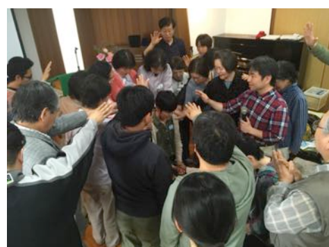
(最後には各教会のために祈る!)