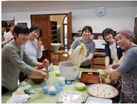
(一緒に名物の「だまこ鍋」づくり)