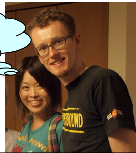
昌代・チェインパレン

「JCMN の短期宣教は今年で4回目でした。私は、そのうちの3回に 参加しました。今回は、参加教会数が今までで一番多かったことがよかったです。続けてきた意味があり、 宣教がムーブメントになり始めているというのが見えて来たと思います。今回は、10代から60代まで 幅広い参加者がいたこともうれしかったです。私は2年連続で宮古チームに参加しました。去年は、仮設 に引っ越したばかりの時期でしたが、今年は仮設での生活が1年を経過しコミュニティが出来て来てい ました。その被災者の方と、長期宣教師たちが関係づくりをしていたのが感動し、励まされました。」