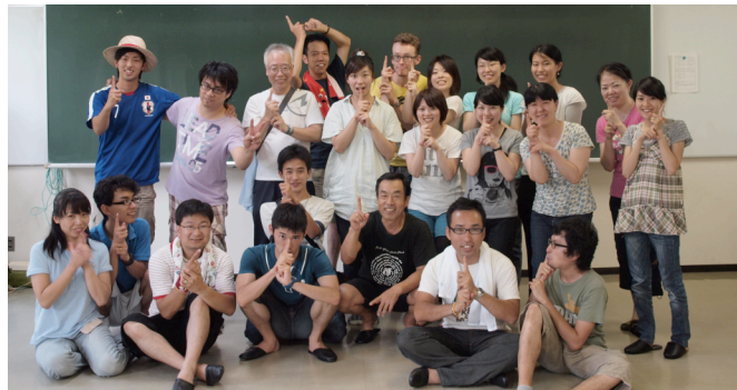
←短期宣教の参加者と

また、この夏に来たチームもとにかく熱く燃えていました。まず、7月下旬のCCMNの短期宣教チームは、真っ赤で見るだけで暑いチームTシャツを着て来て、ホットドックパーティなどの熱い働きをしてくれました。8月下旬のJCMN（日本のセル教会ネットワーク）短期宣教チームも暑い中、公園の清掃活動をしてくださいました。私も、短期宣教のトレーニングキャンプ（下の写真）