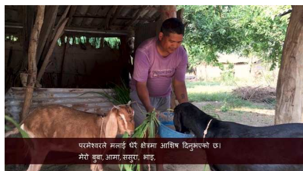
परमेश्वरले मलाई धेरै क्षेममा आशिष दिनुभएको छ। मेरो बुबा, आमा, ससुरा, भाइ,

に造られた人の尊厳や主体性を踏みにじる「偽りの教え」を見きわめ、隣人愛に生きようと、創造的で忍耐強い働きかけを展開している報告がいくつもなされました。大手メディアでも伝えられているように、アジアのいくつかの国で聖書の生ける神に従うとき、過酷な状況に直面します。この逆境にあっても、豊かな創造性を使って人に仕える姿に、イエス・キリストが共におられる息吹を感じて、本来の自分を取り戻す人々が起こされていくことを思わずにはいられませんでした。