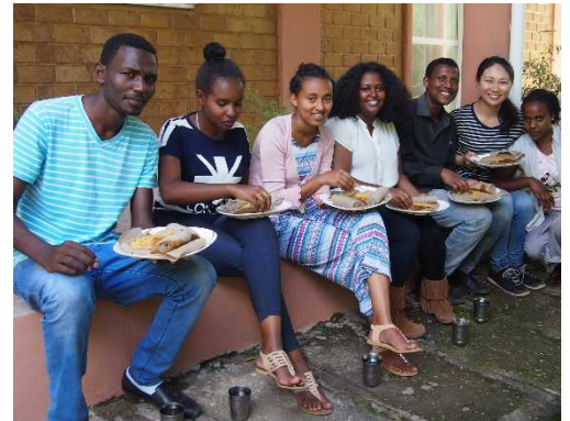
FVIが関わる、クリスチャン大学生を育てる団体の合宿には430名の大学生が集まり、聖書の価値観に基づいたリーダーシップについて1週間学びました。

新しい世代が育ったこれからのエチオピアでできる貢献は、仕事において、収入だけでなく主体性と創造性を発揮して他者を思いやり、社会を良くするために働き、自らも向上し続け、時に勇気をもって新たな挑戦をしていける、そのような「真に自立した次世代」の育成に仕えていくことだと思われています。方法の一つとして、人材育成が行き届いていないエチオピアのサービス業、主に飲食店の従業員をトレーニングする事業を、現地の会社と共同で行うことで事業拡大を目指し、将来的には貧しい人々も働ける職場へと成長させていくことを目指すことを計画しています。今後の取り組みを覚えてお祈りいただけますと幸いです。(湯本)